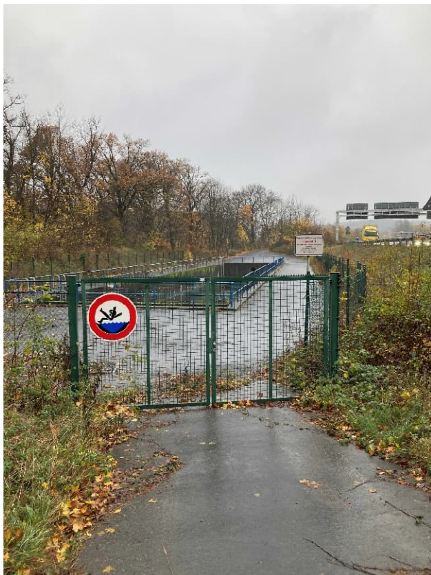
Abbildung 9: Vorhandene Zaunanlage - Detail Toranlage