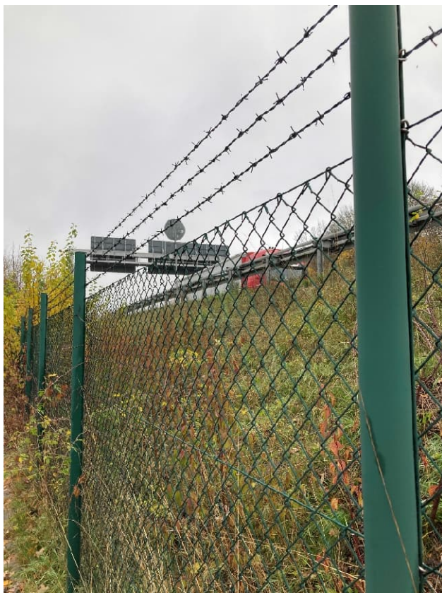
Abbildung 8: Vorhandene Zaunanlage - Detail Stacheldraht