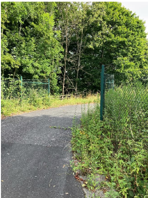
Abbildung 10: Künftige Zaunanlage - Detail Asphaltfläche