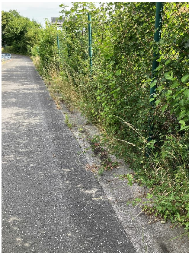
Abbildung 6: Vorhandene Zaunanlage - Detail Entwässerungsrinne