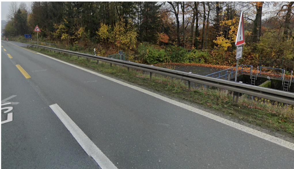
Abbildung 2: Lage RWBA zur BAB A1 in Fahrtrichtung Wuppertal