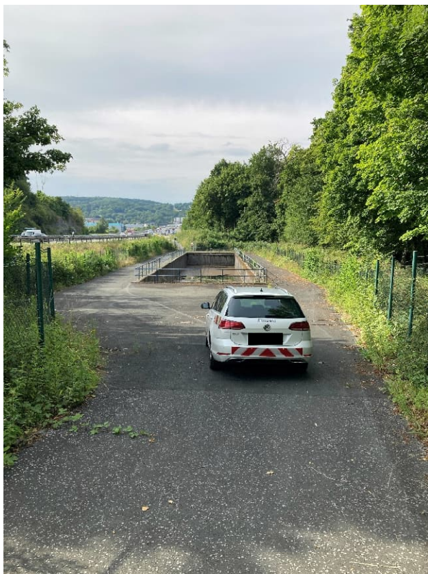
Abbildung 4: Übersicht Standort RWBA Langerfeld 1