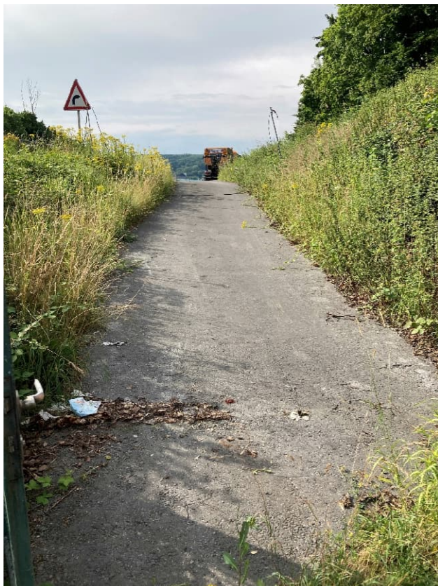
Abbildung 3: Zuwegung RWBA Langefeld 1