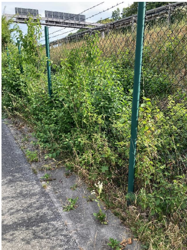
Abbildung 7: Vorhandene Zaunanlage - Detail Zaun