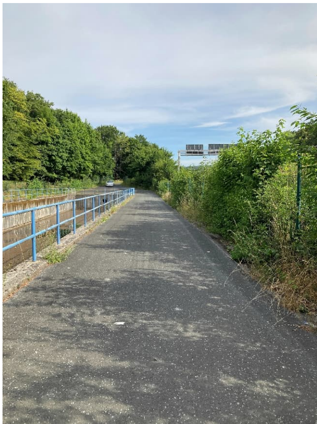
Abbildung 5: Umfahrung RWBA Langerfeld 1